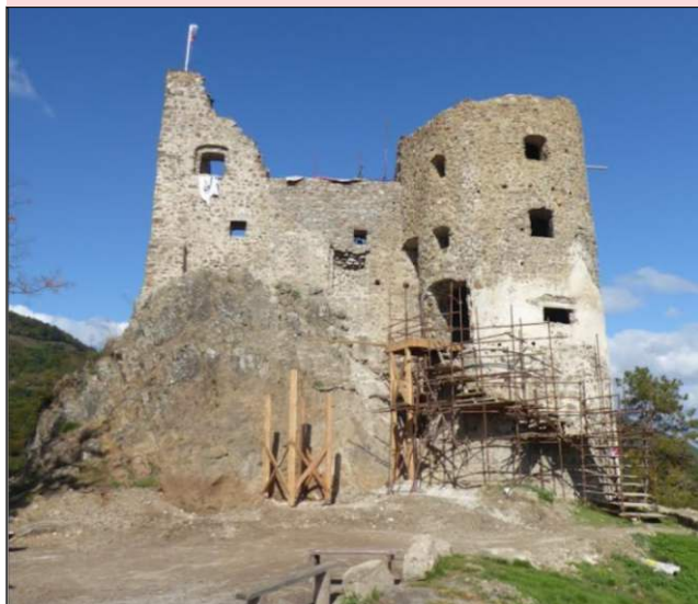
Južná stena južného paláca na začiatku sezóny 2021.