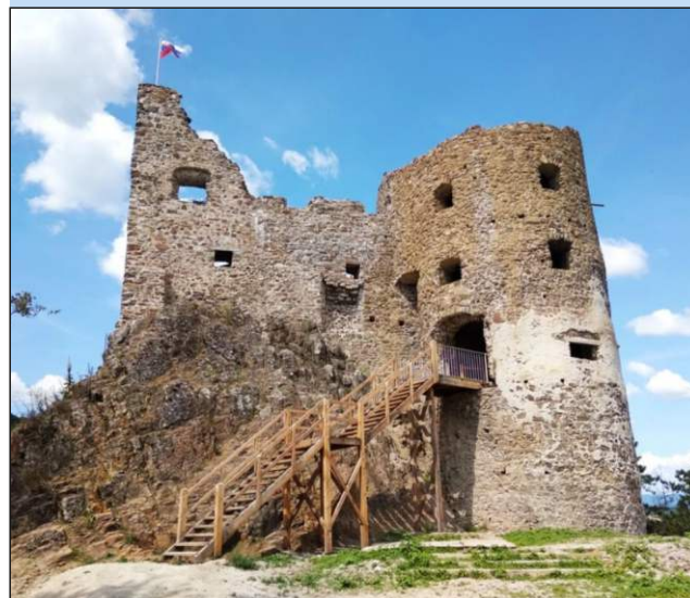
Novovybudované schodisko do delovej bašty.